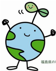
福島県の地球環境保全キャラクター エコたん